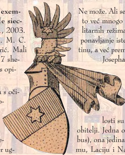
Frangepan v. Vegilia u. Modrus

Godine 2003. je u Parizu tiskana jedna knjiga s očitom namjerom friziranja i novog modeliranja povijesti dviju hrvatskih plemenitaških obitelji: izumrlih glasovitih grofova i markiza Frankapana s jedne, i postojećih vitezova Doimi di Delupis, s druge strane. U hrvatskome bi prijevodu naslov knjige glasio: »Frankopani. Primjer ugleda rodova tijekom 17. st. u Europi.« (Hrvatski sveščići, izvan serije br. 1, 2003). U tom su djelu naime, čak i ne tako vješto, isprepletene istina i neistina, ali tako da se nevjerojstivo sve skupa može činiti istinitom pričom. Kako teku poglavlja i pasusi, čak bi se moglo pomisliti da je tu riječ o dva posvema različita pisca! Može li se uopće povijest izmisliti ili naknadno izmijeniti?