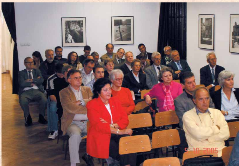
Slika 7. Članovi Zbora na predavanju o projektu Virtualna Hrvatska

U Zboru su trenutačno učlanjeni potomci 52 obitelji, pretežno iz četiri grada: Zagreb, Split, i Osijek i Zadar. Još imamo pojedine članove u Dubrovniku, Opatiji, Voloskom, Puli, Poreču te u inozemstvu: u Velikoj Britaniji, Sjedinjenim državama, Njemačkoj, Švicarskoj i Grčkoj.