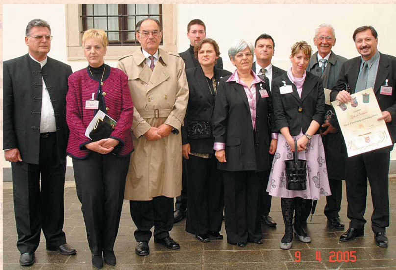
Slika 4. Novo primljeni članovi na Sjednici Velikog plemićkog vijeća 2005.

Ukupno je do sada održano 8 sjednica Velikog plemićkog vijeća. Pet u Zagrebu i po jedna u Nišu, Kninu i Samoboru. Nakon svake promjene Statuta uslijedila je složena procedura odobravanja u prvo vrijeme u Ministarstvu uprave, a zatim u Odjelu za udruge Gradske skupštine Zagreba. Bilo je dosta poteškoća posebno zbog korištenja dijela hrvatskog grba kao grba udruge kao i riječi »hrvatsko« i svih njenih derivacija. Također je trebalo prilagoditi statut i promjeni zakona 11. listopada 2001. godine.