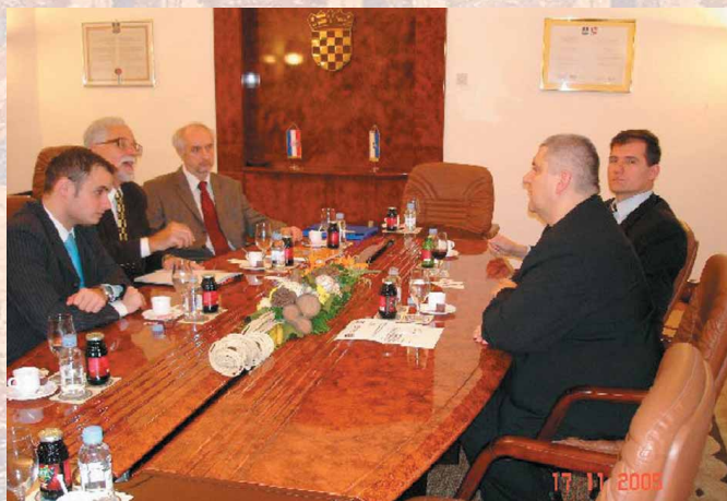
Slika 2. Delegacija HPZ kod gradonačelnika Đapića

Nakon posjeta Osiječkom muzeju delegacija je bila primljena kod gradonačelnika gospodina Ante Đapića s kojim je bio i dogradonačelnik Goran Matković. Nakon obostranog predstavljanja Grada i Zbora u dužem ugodnom razgovoru izmijenjene su informacije o mogućnosti suradnje, te je zamoljena pomoć Grada Osijeka Ogranku-Osijek HPZ. Gradonačelnik Đapić je obećao materijalnu pomoć i da će osigurati prostor za rad Ogranka, a Zbor će pomoći Ogranku stručno u radu na promicanju načela, strategije i operativnog plana Zbora.