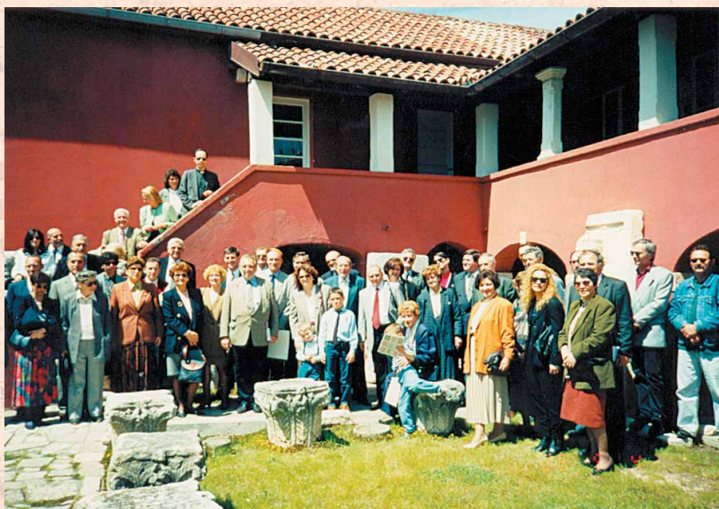
Slika 2. Učesnici sjednice Velikog plemićkog vijeća u Ninu ispred Muzeja