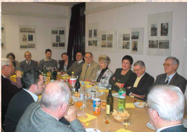
Slika 8. Božićni domjenak 2005. godine

Za svaki Božić imali smo posebno druženje članstva sa domjenkom