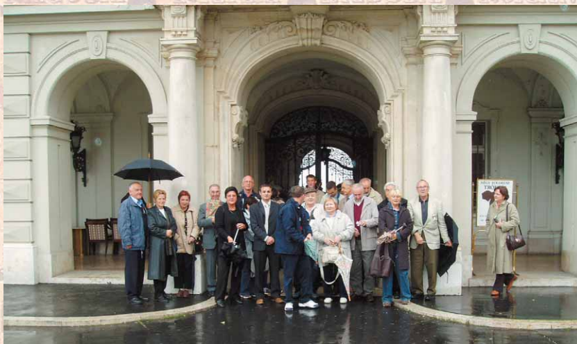
Slika 10. Brojni članovi HPZ pred dvorcem Festetić na Balatonskom jezeru