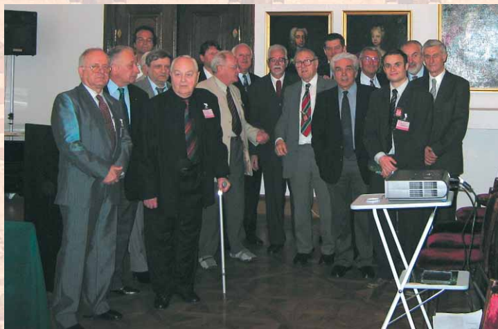
Slika 13. Članovi radnih tijela Zbora izabrani 2005. godine

Od osnovnih sredstava imamo jedan kompjuter, printer, stol za kompjuter i jedan ormar.