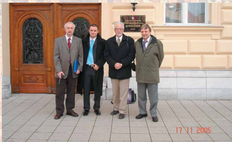
Slika11. Osnivanje Ogranka Osijek 17. 11. 2005.