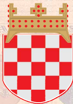
Slika 3. Grb Hrvatskog plemićkog zbora

Tako započinje Statut koji je prihvaćen još na Osnivačkoj skupštini nakon tri godine upornog rada Utemeljitelja. U tom Statutu su definirani naziv Hrvatski plemićki zbor odnosno Colegium nobilium croaticum , grb Zbora, povijesni – hrvatski grb u obliku štita, povrh kojega je stilizirana zlatna kruna hrvatskih kraljevâ ukrašena rubinima, krajevi koje ulaze u štit.